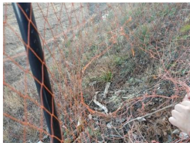
破網したステンレス入りネット