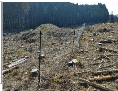
ロープ無しで垂れのない自立性