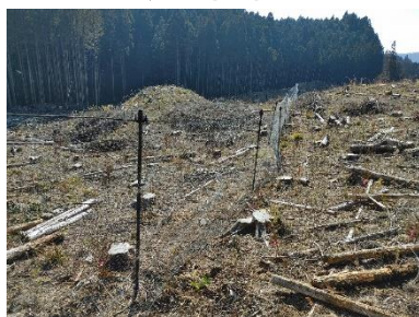
ロープ無しで垂れのない自立性