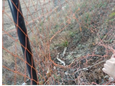
破網したステンレス入りネット