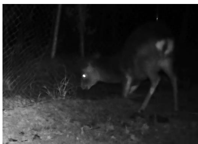
ネットに噛付くシカ

「鹿 た まったくん」は東レ株式会社製熱硬化ポリエステルを使用した硬化ネットです。従来のステンレス線入りの防獣ネットに比べ耐摩耗性がアップし、噛み切りによる破網を防ぎます。