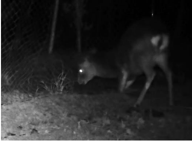
ネットに噛付くシカ

「鹿 た まったくん」は東レ株式会社製熱硬化ポリエステルを使用した硬化ネットです。従来のステンレス線入りの防獣ネットに比べ耐摩耗性がアップし、噛み切りによる破網を防ぎます。