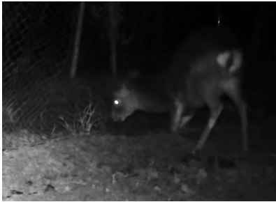
ネットに噛付くシカ

「鹿 た まったくん」は東レ株式会社製熱硬化ポリエステルを使用した硬化ネットです。従来のステンレス線入りの防獣ネットに比べ耐摩耗性がアップし、噛み切りによる破網を防ぎます。