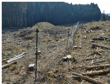
ロープ無しで垂れのない自立性