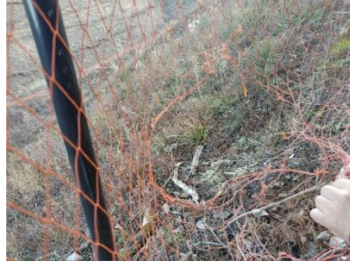
破網したステンレス入りネット