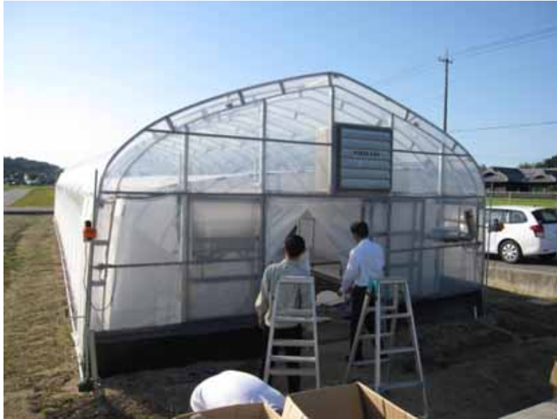
試験ハウス全景 (120m 2 、間口6m × 20m)