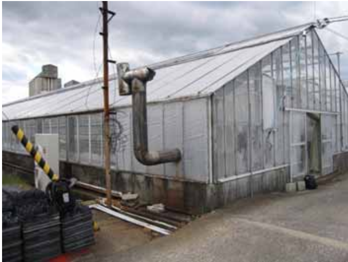
ハウス全景(376m 2 、間口9.4m × 40m)