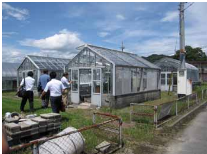
試験ハウス全景 (19.8m 2 、間口3.6m × 5.5m)