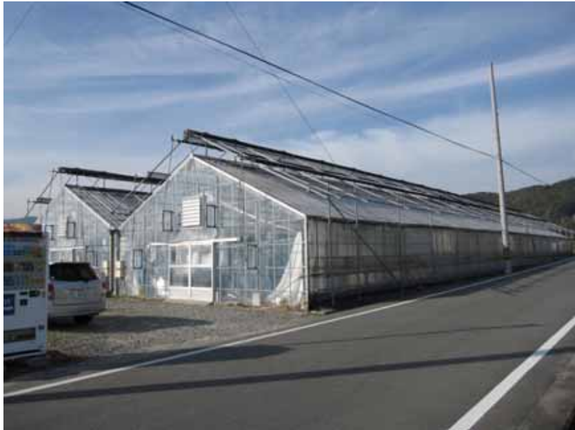
ハウス全景 (949m 2 : 間口10m × 2連棟 × 奥行47m)