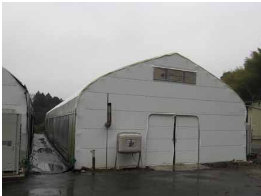
(392㎡、間口7.2m × 25m: しいたけ保管ハウス)