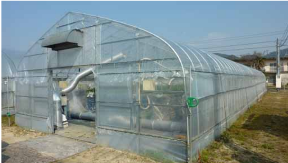
試験ハウス全景 (136m 2 、間口6.2m × 22m)