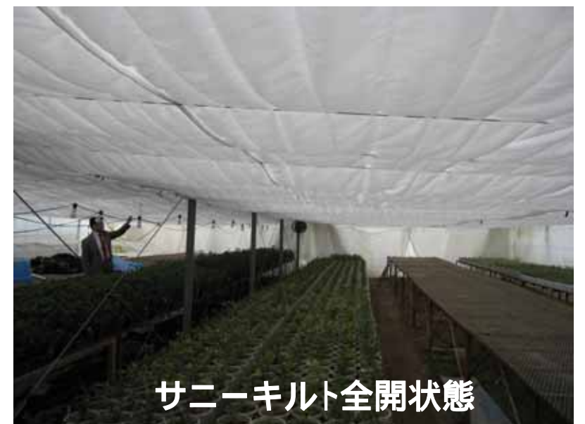
サニーキルト全開状態