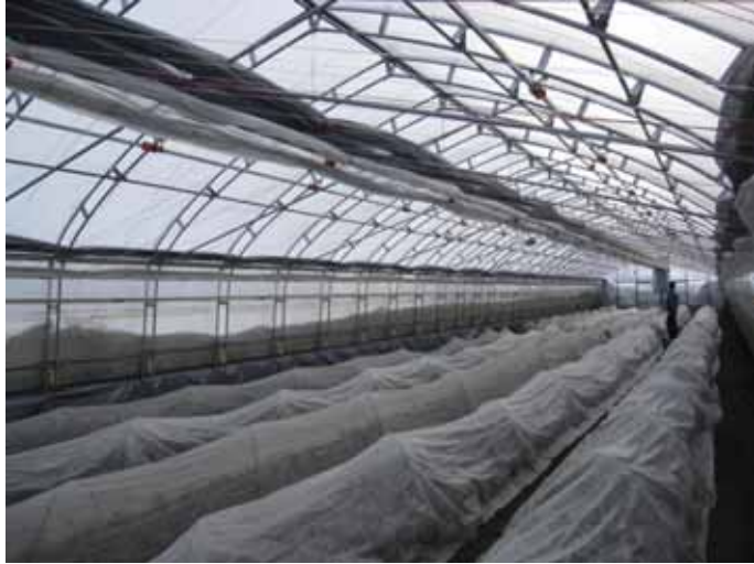
ハウス全景 (403m 2 、間口8.4m × 48m)