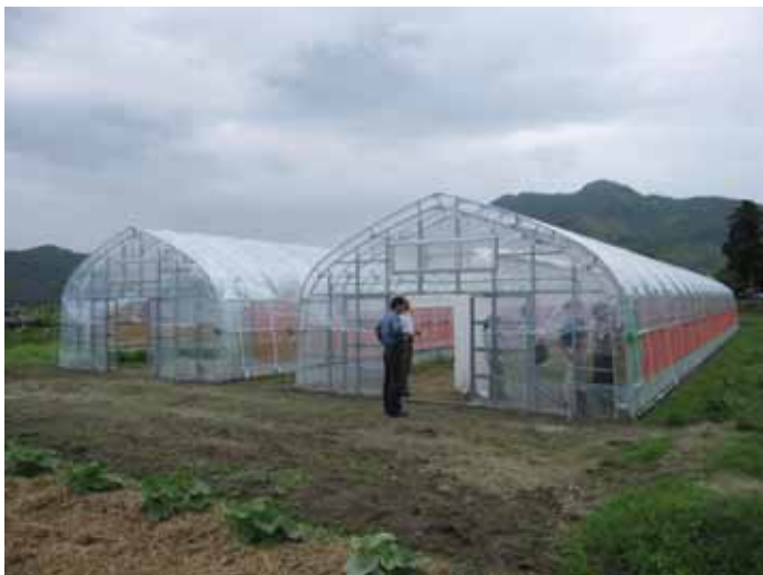
試験ハウス全景 (180m 2 、間口6m × 30m)