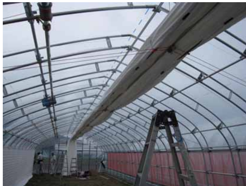
屋根部収束量 15cm ~ 24cm